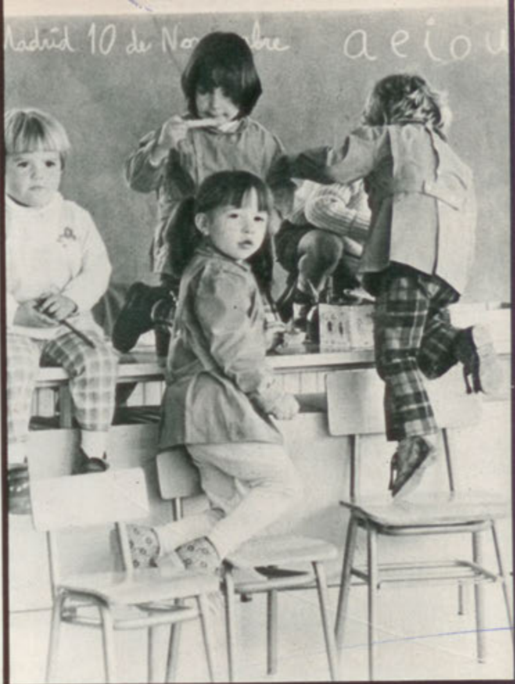
Los colegios siguen subiendo.

Otro punto importante es el de los sueldos del profesorado. Todavía el profesorado español está mal pagado. Y eso que, por poner un ejemplo, en el convenio para la enseñanza no estatal de Madrid se han aumentado sus salarios en cuantía importante, aunque no suficiente. Como consecuencia de este aumento, los colegios verán incrementadas sus cotizaciones a la Seguridad Social —se calcula en un 30 por 100 más que antes— y también tendrán que pagar más a los profesores. Este aumento repercutirá en los precios de los colegios, ya que en el propio convenio se prevé esta posibilidad. Con todo ello es fácil asegurar que los colegios van a subir este curso en un 20 ó 30 por 100, como mínimo.